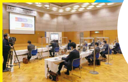
※許可者以外、動画・写真撮影「厳禁」